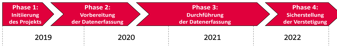
Zeitplanung des Projekts „PlanDigital“

Die Digitalisierungsoffensive für raumbezogene Fachdaten in Niedersachsen